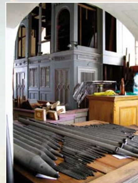
Varhany Rumburk

Klára Mágrová, koordinátorka projektu, Rumburk, redakčně upraveno