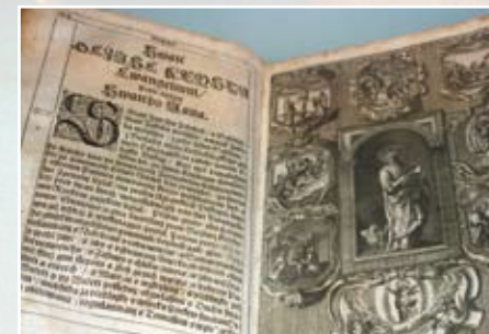
Bible svatováclavská, foto Jan Suchánek

„Stav střechy kostela sv. Jana Nepomuckého ve Starých Křečanech je havarijní.