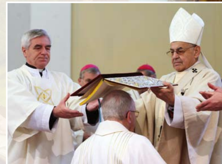
Jáhny drží při obřadu evangeliář nad svěcením.

Povedlo se kupříkladu to, že z těch jednotlivých pastoračních setkání s kněžími, jáhny, pastoračními asistenty, varhaníky, sbormistry, mládeží, nemocnými, se starými lidmi i s lidmi, kteří nesou odpovědnost za stav ve společnosti, to znamená s politiky, se zastupiteli obcí a měst, že všude jsem se přesvědčoval o tom, a tomu přikládám úspěch – ne můj, ale křesťanství a úspěch Kristova učení – že při takových setkáních si vždycky všichni zúčastnění vážili toho, že