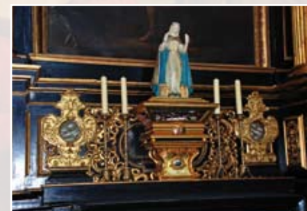
Reli kv iář na ostatky sv. Zdislavy v katedrále