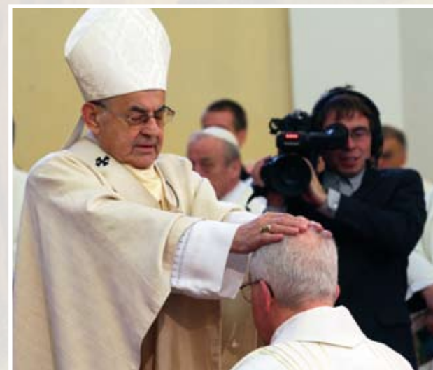
Hlavní světitel, kardinál Miloslav Vlk, vkládá ruce na svěcence.