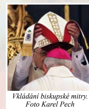
Vkládání biskupské mitry.