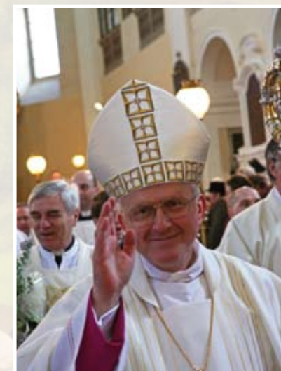
Žehnání věřícím.