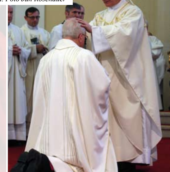
Spolusvětitel, apoštolský nuncius v České republice Diego Causero, vkládá ruce na svěcence.