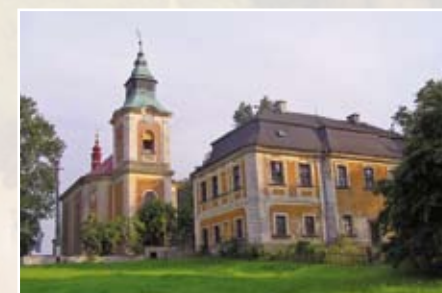
Kostel sv. Jana Nepomuckého ve Starých Křečanech, foto Klára Mágrová