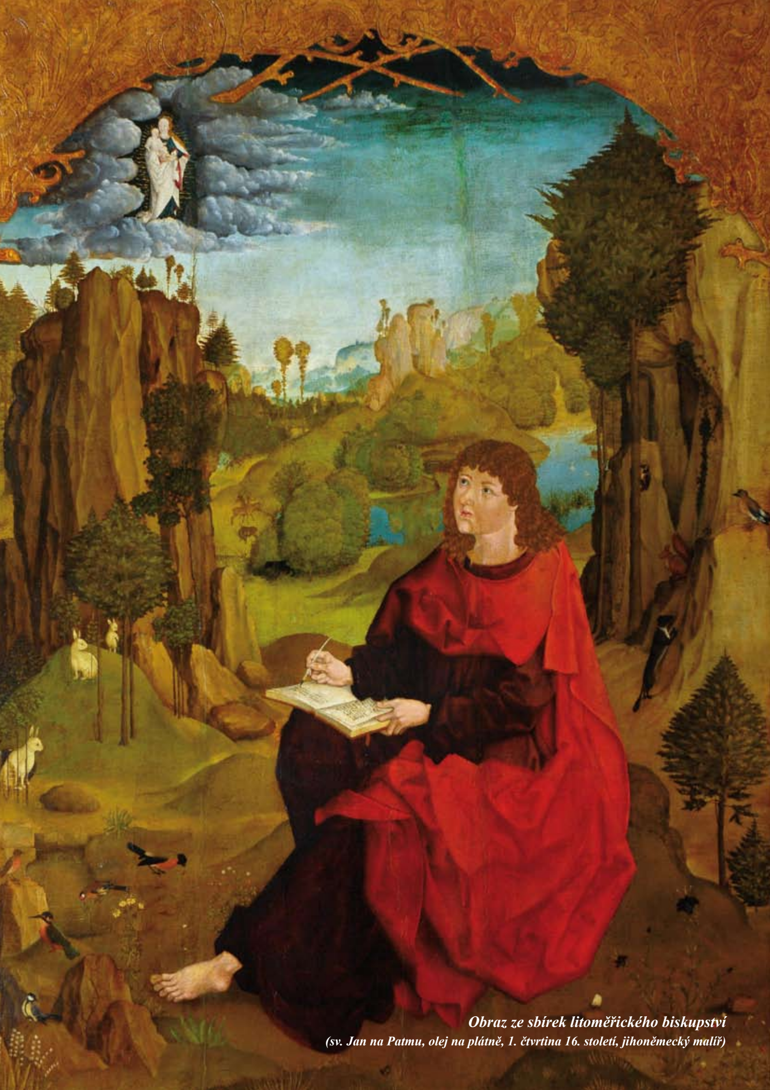
Obraz ze sbírek litoměřického biskupství (sv. Jan na Patmu, olej na plátně, 1. čtvrtina 16. století, jihoněmecký malíř)