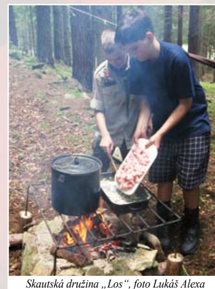
Skautská družina „Los“