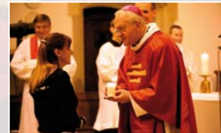
Mše pro studenty v Ústí