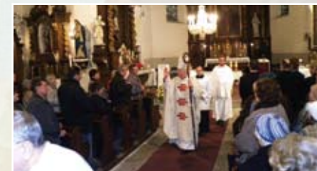
Kostel Cvikov, foto Jan Policer