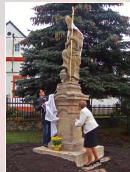
Reinstalace sochy v Mukově