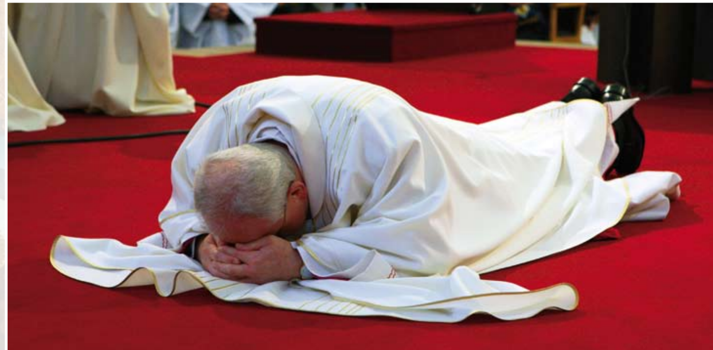
Litanie ke Všem svatým, kdy se světec položí v prostraci na zem.